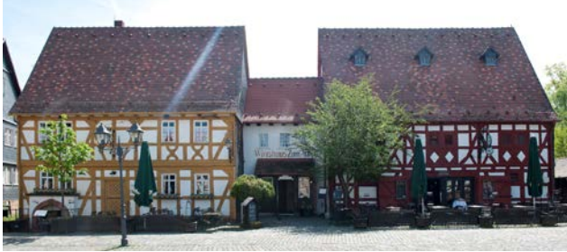
Wirtshaus „ Zum Adler “

Gegen 13:00 Uhr kehren wir zum gemeinsamen Mittagessen im Wirtshaus „ Zum Adler “ (wie treffend) ein. Die Auswahl bzw. die Vorbestellung der Gerichte wird bereits am Morgen bei Ankunft im Prüfcenter der SVS anhand ausgelegter Speisekarten erfolgen, da wir bis spätestens 11:00 Uhr die Anzahl der ausgewählten Gerichte telefonisch übermitteln müssen. Das Essen und die Getränke sind von jedem Clubkameraden selbst zu zahlen.