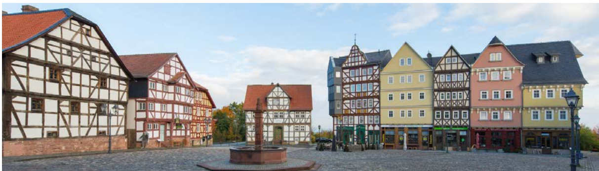
Marktplatz des Freilichtmuseums Hessenpark

So gegen 12:00 Uhr unternehmen wir eine Ausfahrt (ca. 30 km) in das Freilichtmuseum Hessenpark. Wir dürfen unsere Oldtimer auf dem Marktplatz des Hessenparks präsentieren. Die Verwaltung des Freilichtmuseums hat uns die Einfahrt und Präsentation unserer Fahrzeuge auf dem Marktplatz unter der Auflage erlaubt, dass wir unter den Motorenbereichen eine Pappunterlage zur Vermeidung von Ölflecken verwenden. Wir werden diesbezüglich für alle Clubkameraden entsprechende OilPad-Umweltschutzmatten zur Verfügung stellen, sodass es zu keinen Verunreinigungen kommen kann. Die OilPad-Umweltschutzmatten dürfen anschließend auch gerne zur weiteren Verwendung einbehalten werden.